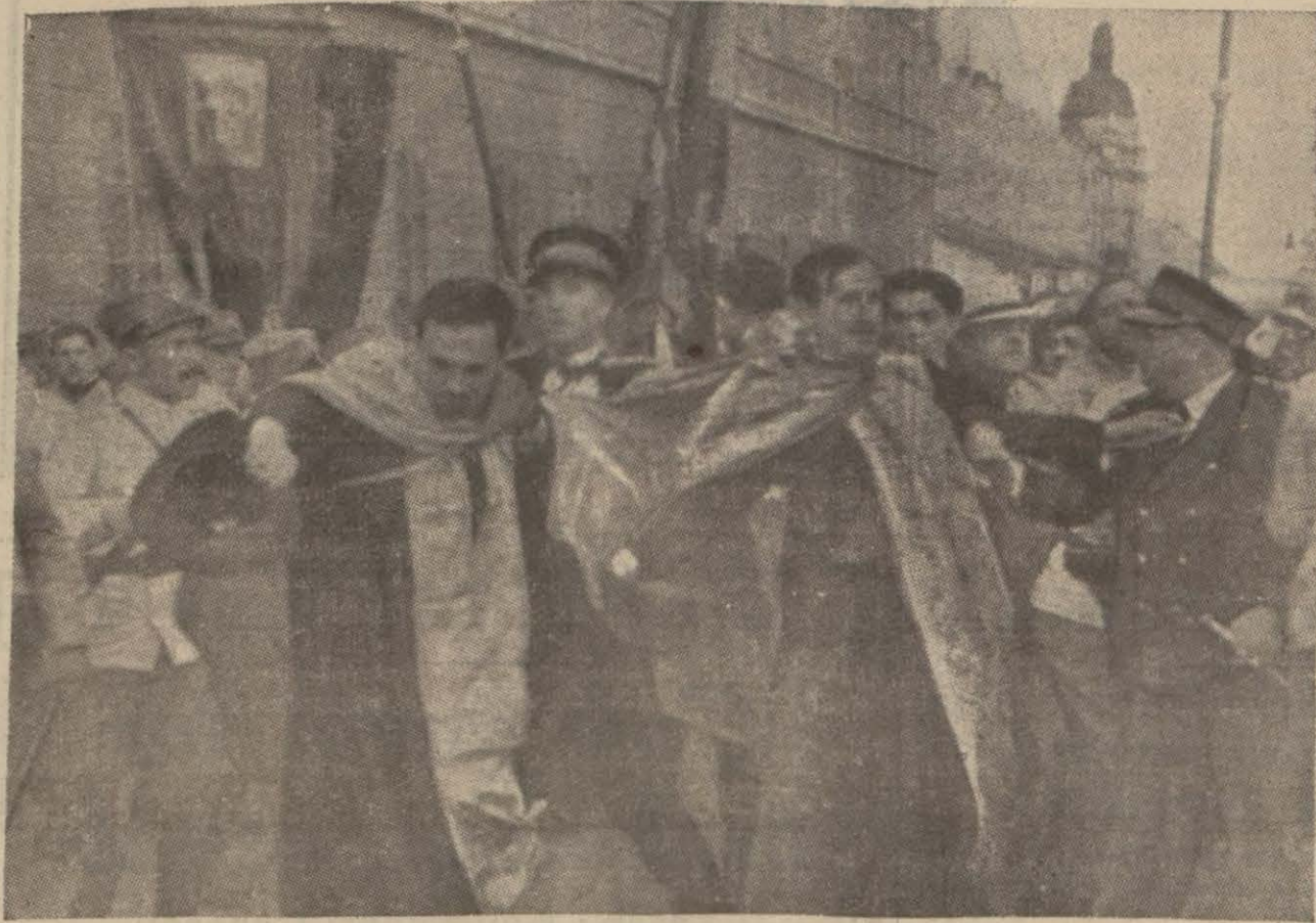
Belgrad sokaklarında bir arbede