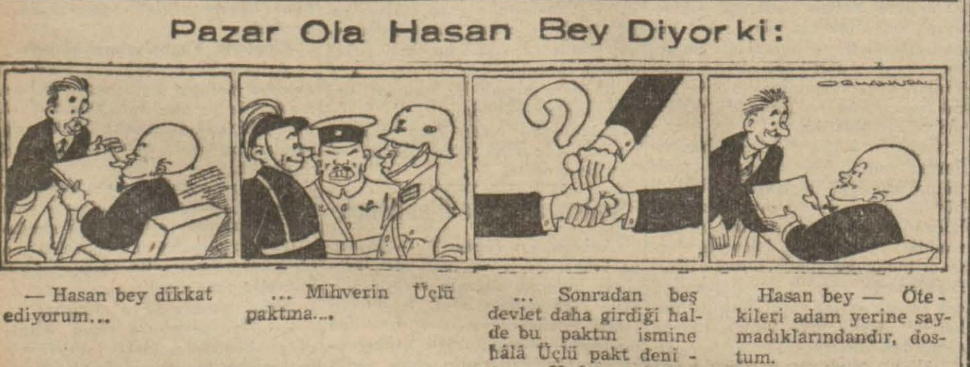
— Hasan bey dikkat ediyorum... — Mihverin Üçü paktına... — Sonradan beş devlet daha girdiği halde bu paktın ismine hâlâ Üçlü pakt deniyor... Neden acaba? — Hasan bey — Ötekileri adam yerine saymadıklarındandır, dostum.

Dünya muharrirlerinden tereşmeler serisi numara: 44.