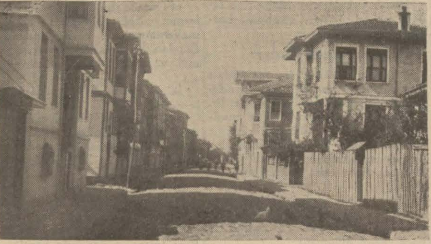
Aşağı Nazilliden bir görünüş

Köylünün en çok müşkülâtla karşılaştığı doğum işleri üzerinde iyi kararlar alındı